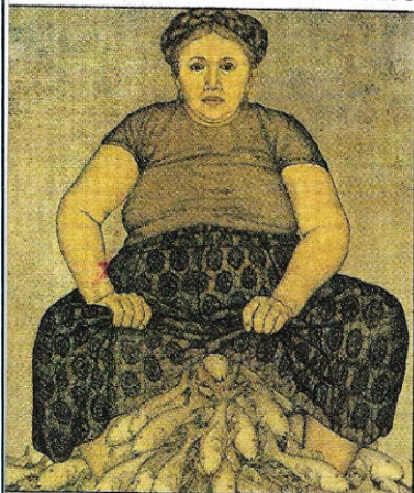
"Señora y peces", 1985. Obra de Nahum B. Zenil.